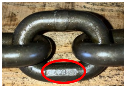
リンクチェーン SV2070 (φ7)