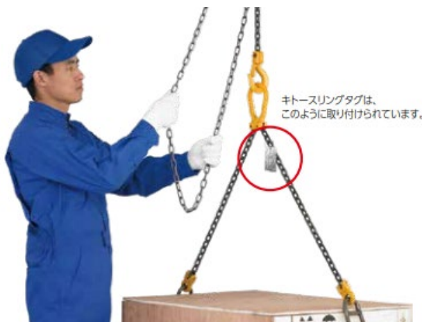
キトースリングタグ